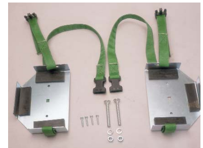
Base Support (comes with nylon retaining straps) Support de base (avec bretelles)

El apoyo de la base tiene correas de sujeción de nylon